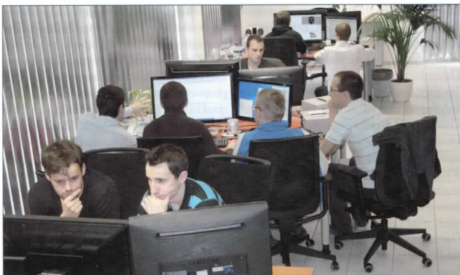
Ein engagiertes junges Team realisiert bei Unicontrol anspruchsvolle Projekte speziell für den Fahrzeugbau.